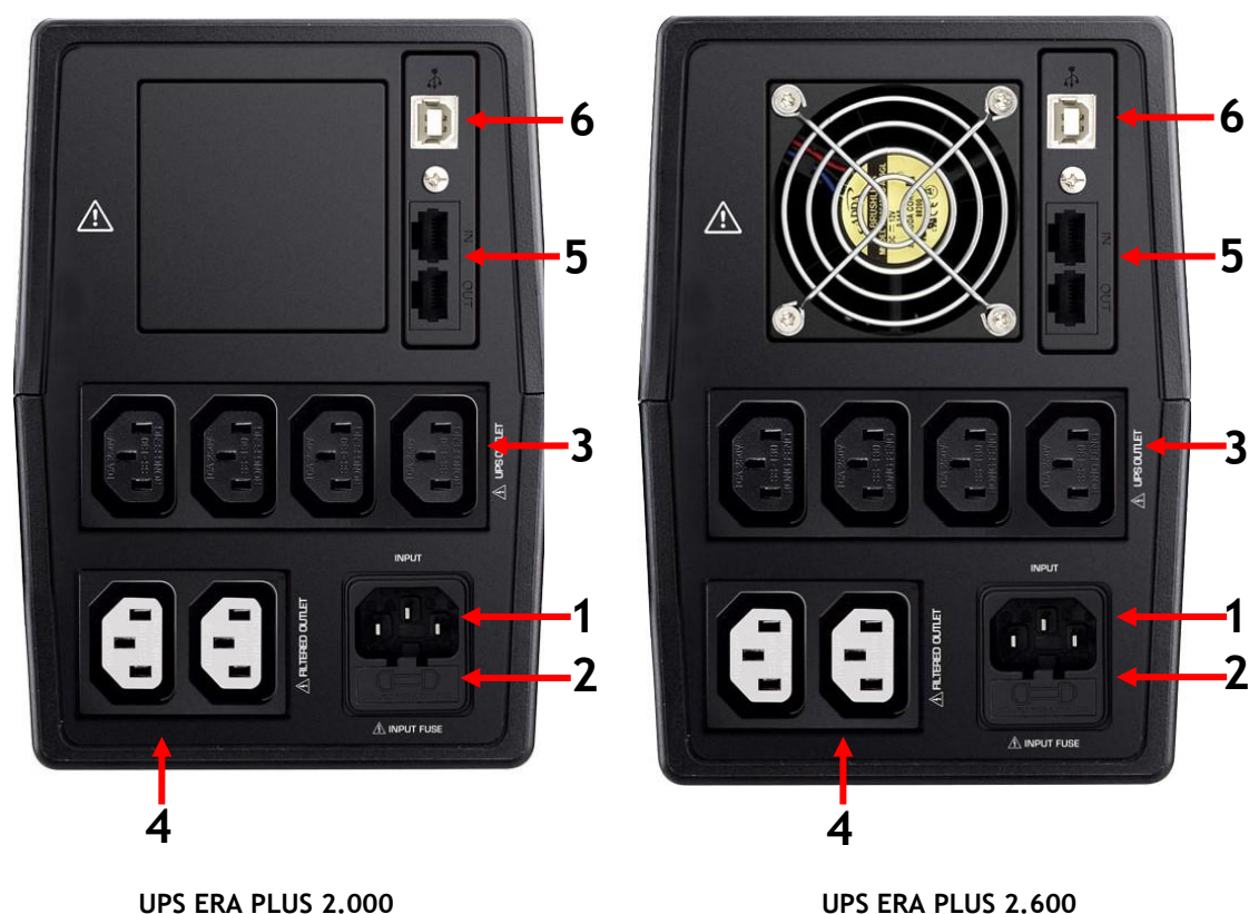
Figura 2 - Pannello Posteriore

Sul retro di ERA PLUS sono presenti (vedi figura 2):